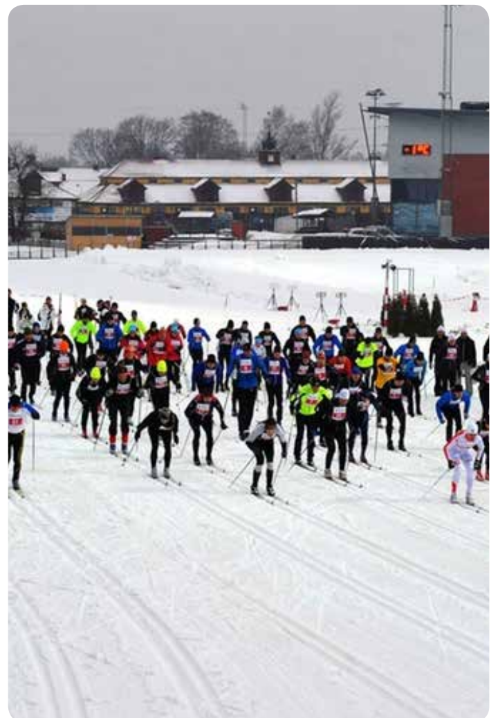
Barn och vuxna fick en härlig skidupplevelse på Solvalla