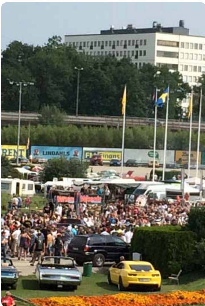
Över 1400 välputsade jänkare på Wheels Nationals