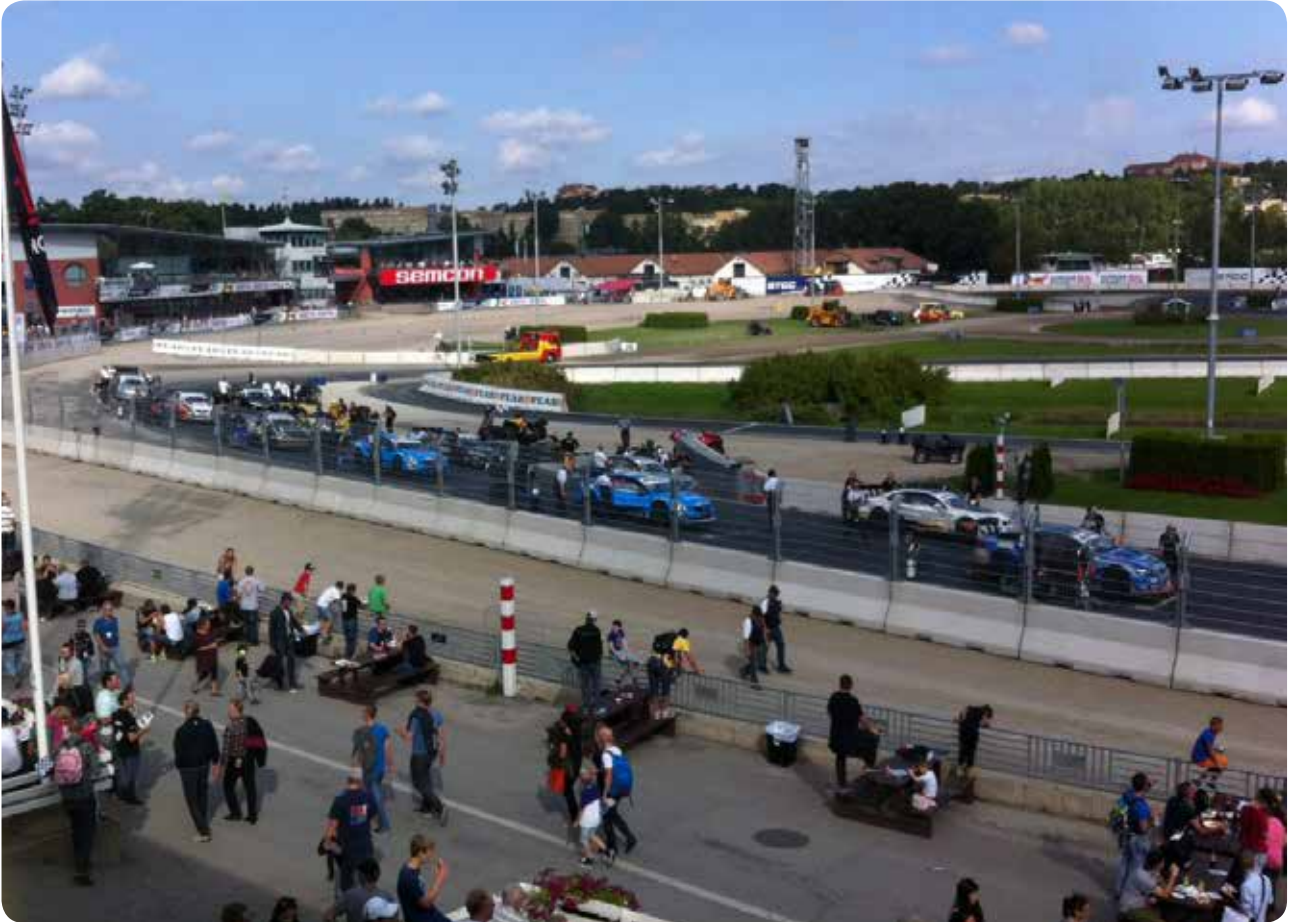
Över 15000 på läktarna såg STCC's näst sista deltävling