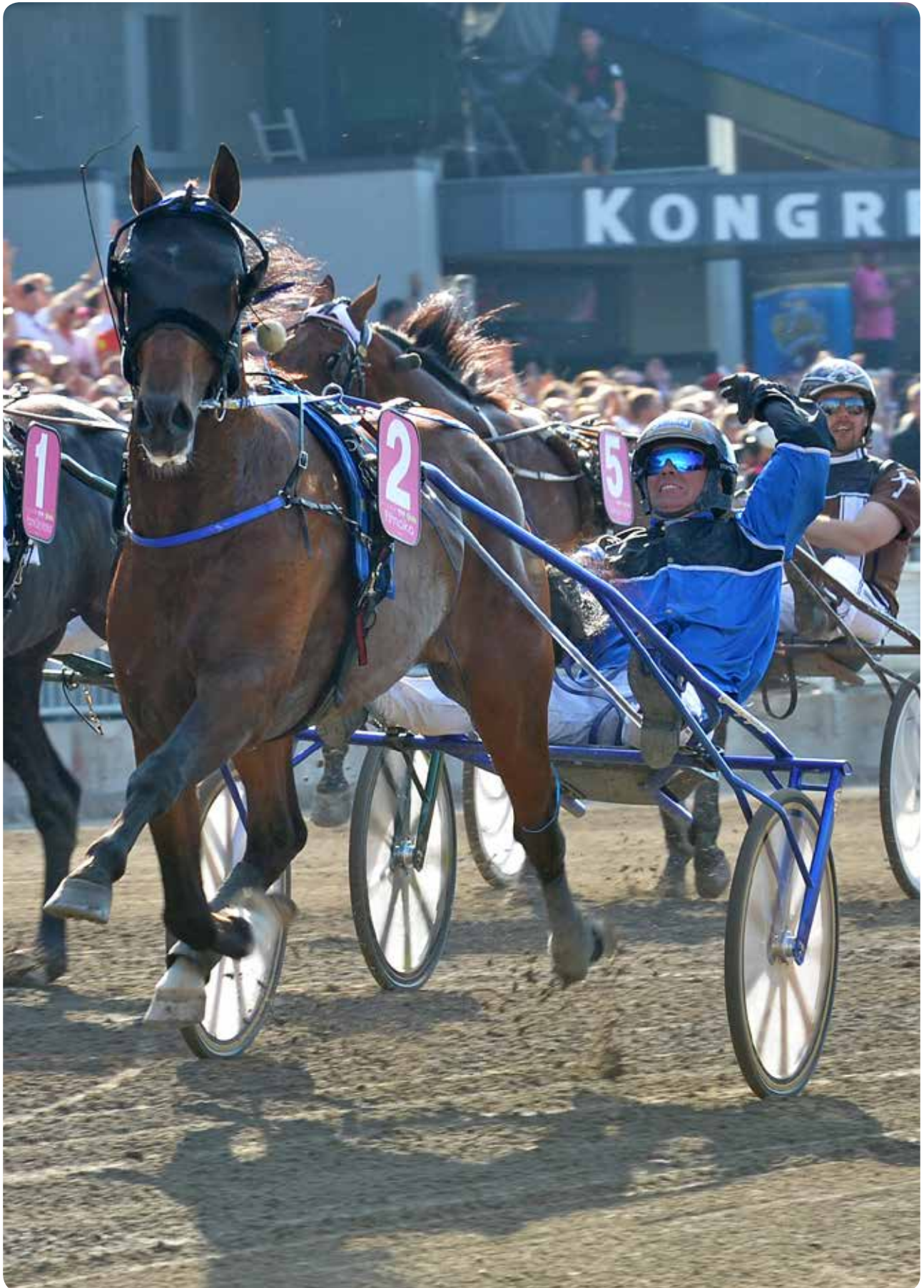
Timoko - vinnare av Elitloppet 2014