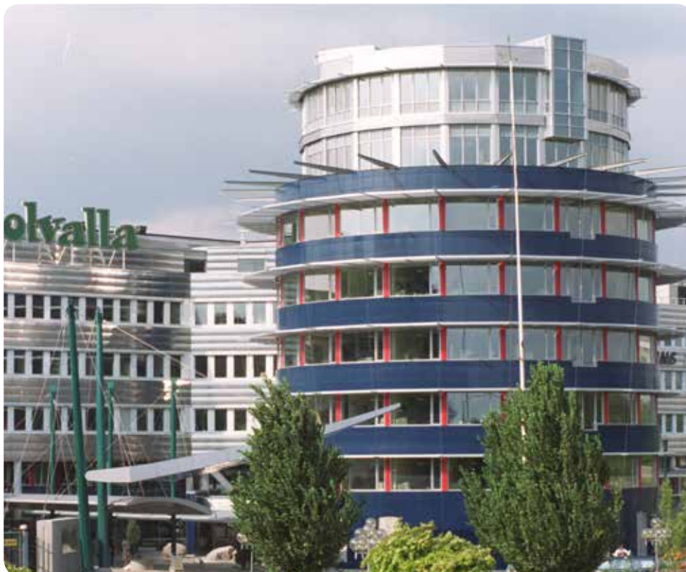
Förhandlingar är inledda, och fortgår, angående en eventuell försäljning av Hästsportens Hus till hyresgästen ATG.

När det gäller arbetet med att skapa förutsättningar för egengenererade medel på icke-travrelaterade event har vi under 2014 genomfört ett 20-tal små och stora event som totalt sett har gett oss nästan 50 000 nya besökare och ett nettoresultat om ca 2,6 mkr. I november månad startade vi upp ett projekt för att skapa en ansiktslyftning på Ströget.