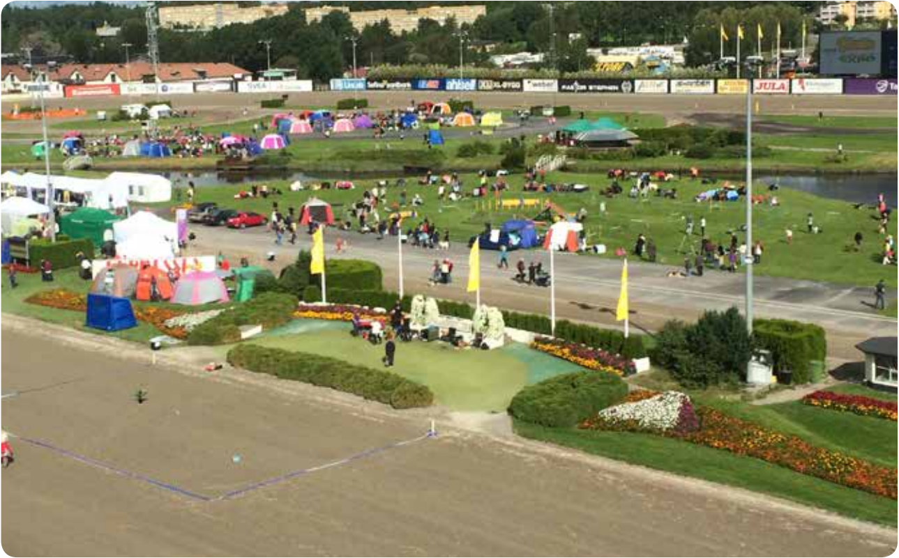
Solvalla Hund & Husdjur Expo är Sveriges största utomhusevent för hund, katt, häst & smådjur