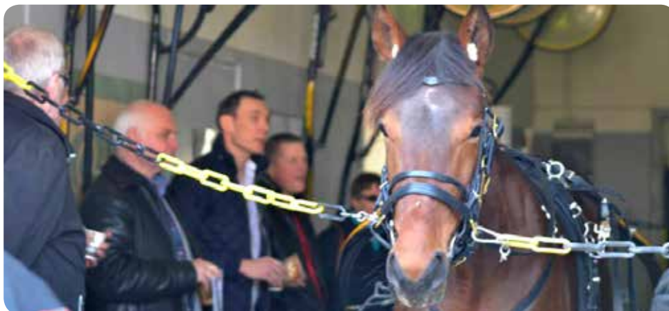
Delägarna visar stort intresse för andelshästen Fontana Boko

2014 var ett strålande år för Solvallas utbildningsverksamhet. Nivån på antal deltagare i Travskolan är mycket stabil och höjdpunkten kom under april när antalet elever nådde nya rekordet 174. Travskolan har Sveriges bredaste kursutbud med hela 25 olika kurser som går löpande under året sju dagar i veckan. Travskolan erbjuder även fritidsverksamhet. Ett upplägg som är uppskattat hos såväl föräldrar som deltagande barn.