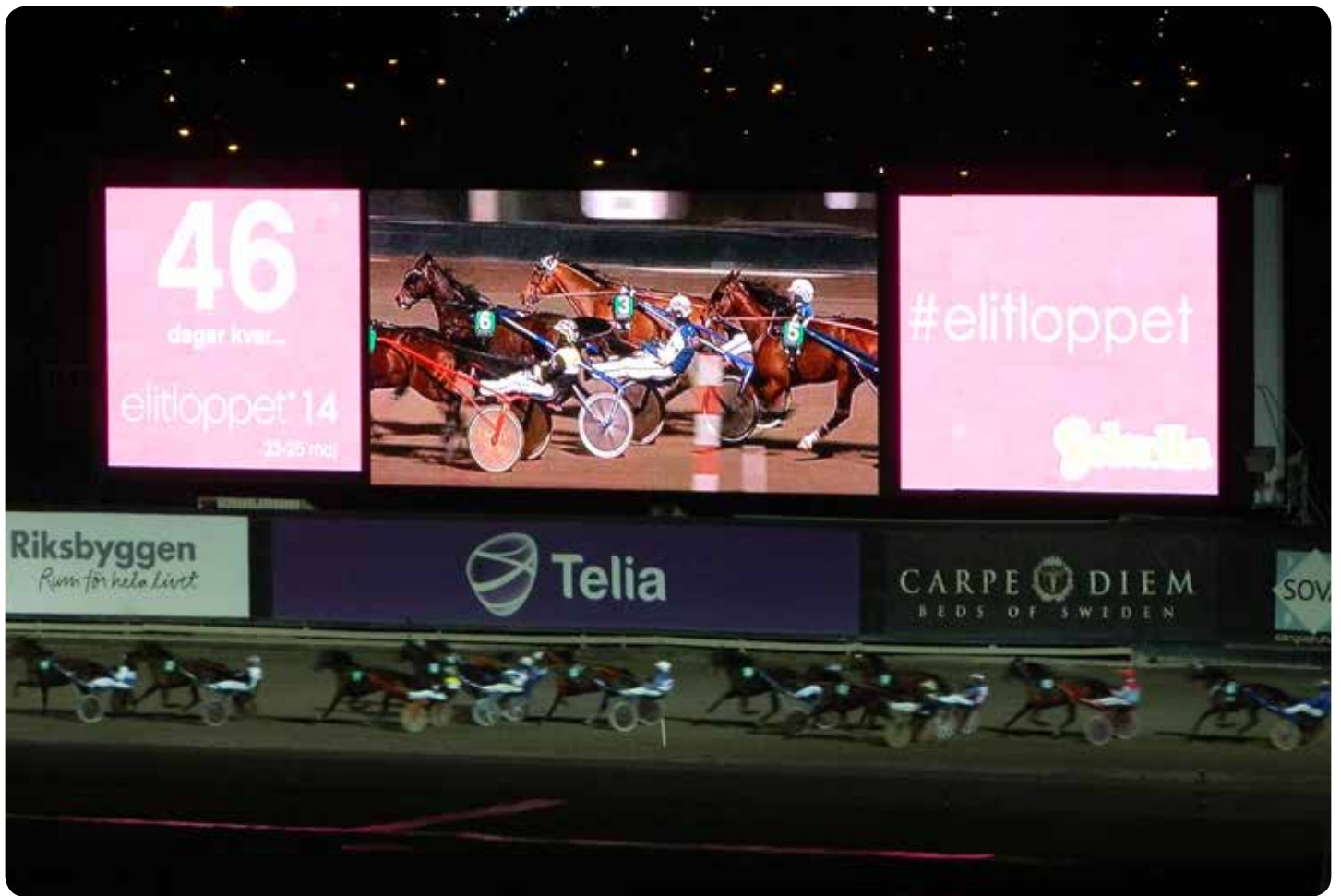
Den nya LED-skärmen kan användas till alla typer av evenemang