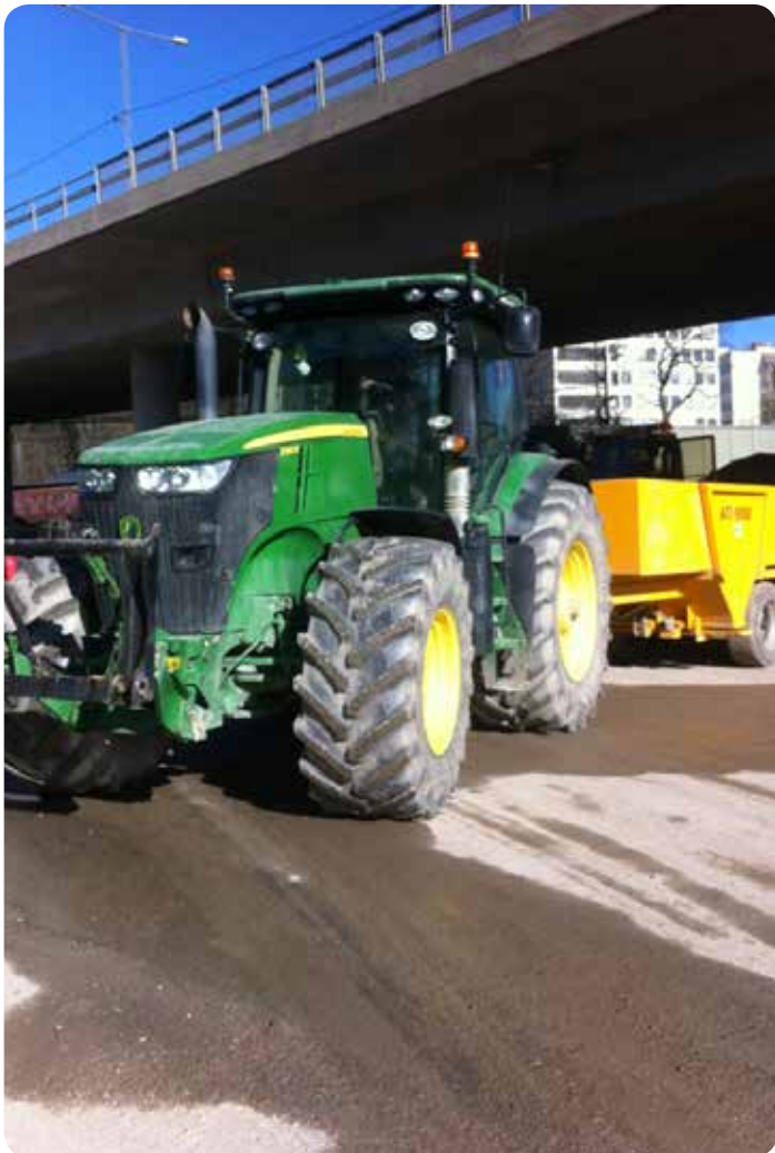
Spridarvagnen har gjort banskötseln enklare och bättre