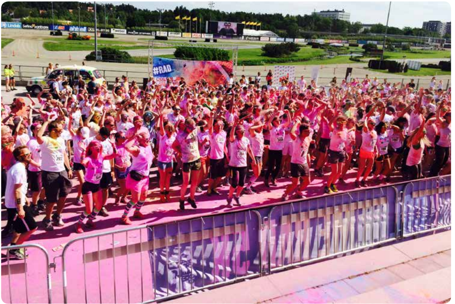
Color Me Rad gjorde succé på Solvalla med 4000 deltagare